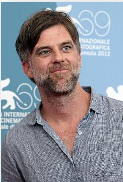
Paul Thomas Anderson (폴 토마스 앤더슨)