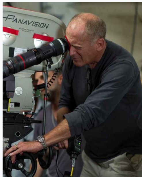
촬영감독 Robert Elswit (로버트 엘스윛)